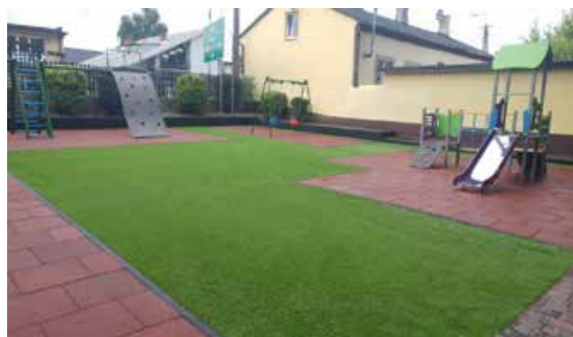
Gmina Miasto Kowal. „Przebudowa placu zabaw w parku im. Leona Stankiewicza w Kowalu” (49 913,00 zł)