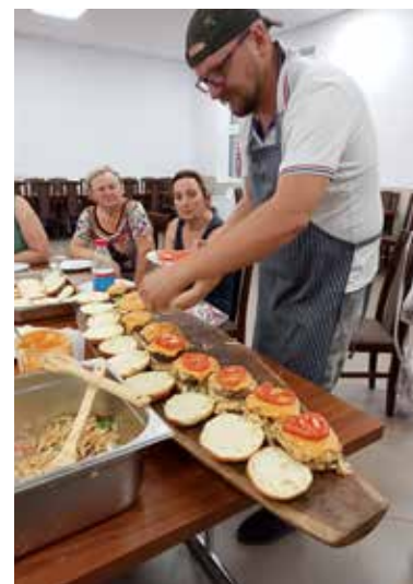
„Wyjątkowo w gminie Baruchowo” (50 000,00 zł)