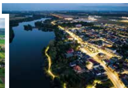
Gmina Lubień Kujawski