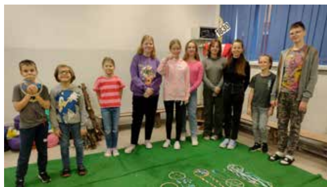
„Klub młodzieżowy w Czerniewicach” (47 966,74 zł)