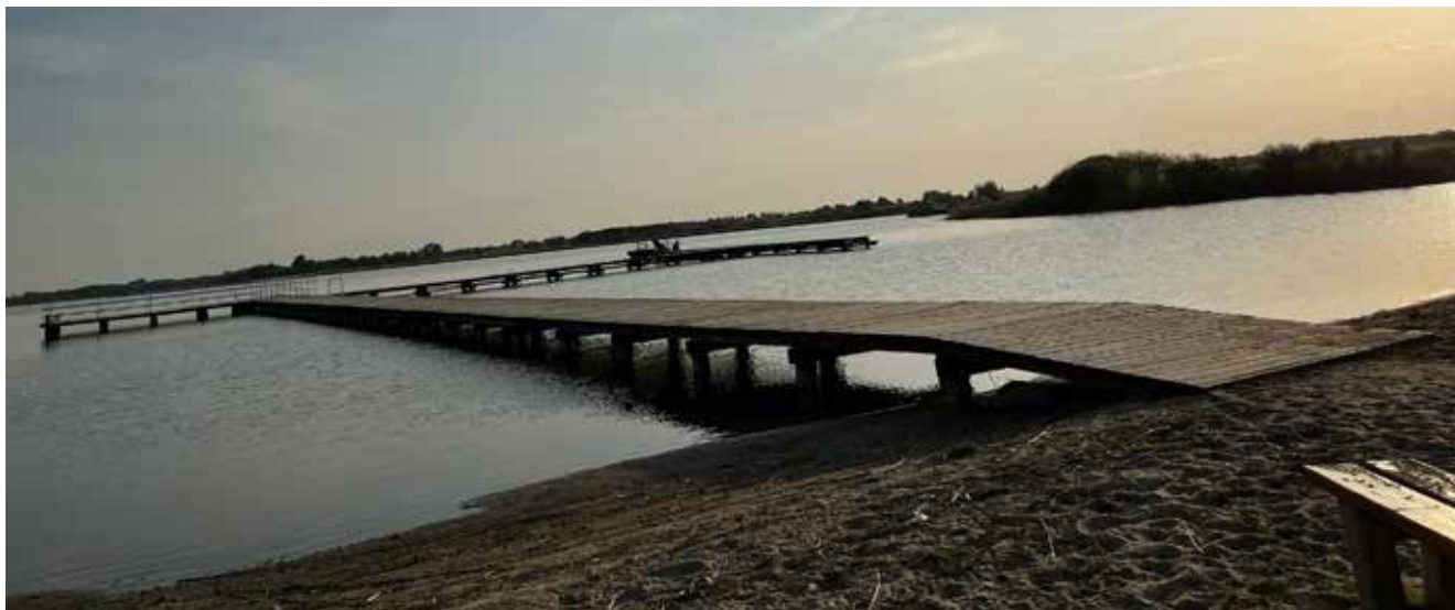
Stowarzyszenie dla Rozwoju Gminy Choceń. „Modernizacja pomostu nad jeziorem Borzymowskim wraz z infrastrukturą towarzyszącą” (115 699,00 zł)

Przykłady projektów w zakresie rozwoju ogólnodostępnej i niekomercyjnej infrastruktury turystycznej lub rekreacyjnej lub kulturalnej w ramach Lokalnej Strategii Rozwoju na lata 2014-2020.