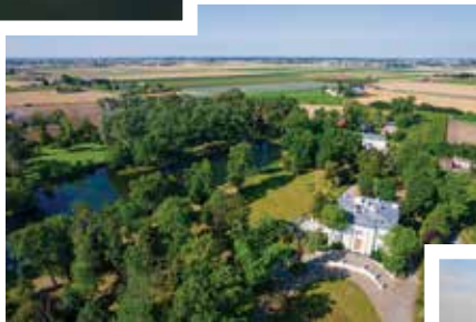
Gmina Włocławek (Smólsk)