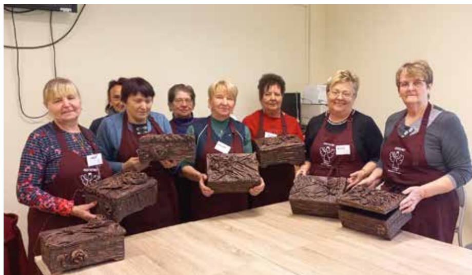
„Aktywni w każdym wieku” (37 088,00 zł)