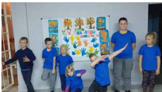
„Klub młodzieżowy w Czerniewicach” (47 966,74 zł)