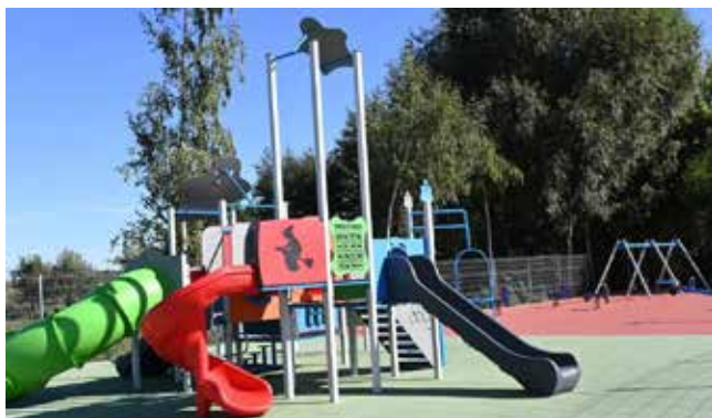
Gmina Boniewo. „Rozbudowa placu zabaw w miejscowości Boniewo” (101 785,00 zł)