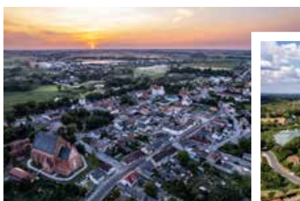
Gmina Brześć Kujawski

nie zewnętrzne, place zabaw, skateparki oraz miejsca ogniskowe. Stowarzyszenie organizuje liczne wydarzenia kulturalne, na których uczestnikami są nie tylko mieszkańcy ale również przyjezdni.