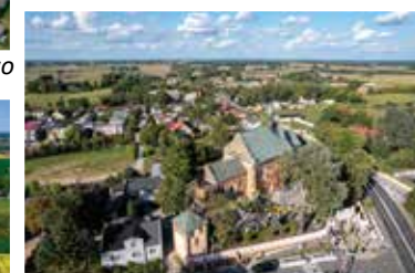
Gmina Izbica Kujawska